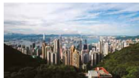
a niekedy násilné protesty proti úsiliu Pekingu posilniť svoje mocenské postavenie v tomto poloautonómnom meste.

od Číny, podvrátnú činnosť zameranú voči centrálnej vláde, zasahovanie zahraničia do miestnej politiky a terorizmu. Podľa kritikov tento zákon nerespektuje princíp "jedna krajina, dva systémy", na základe ktorého mal Hongkong prislúbené väčšie slobody, než platia v pevninskej Číne. Podľa aktivistov v Hongkongu takéto prísne obmedzovanie bude v podstate znamenať koniec osobitného štatútu bývalej britskej kolónie, ktorej voľby, slobodné médiá a ďalšie slobody pomáhajú udržať si postavenie finančného svetového hlavného mesta, takže sa vyrovná aj New Yorku a Londýnu. Hongkongom už vlni otriasali sedem mesiacov trvajúce rozsiahle prodemokratické