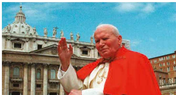
Na námestí sv. petra vo Vatikáne