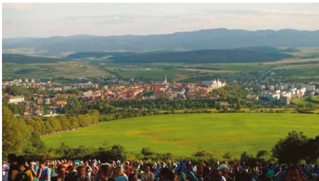
Púť na Mariánskej hore v Levoči

Za 26 rokov svojho pontifikátu Ján Pavol II. vyhlásil 1345 blahorečených a 483 svätých. Od založenia Kongregácie pre kauzy svätých v roku 1588 do začiatku pontifikátu Jána Pavla II. všetci pápeži spolu vyhlásili 1210 blahorečených a 300 svätých. Hlasy, ktoré už po jeho odchode do Otcovho domu volali po čo najskoršom vyhlásení Jána Pavla II. za svätého, boli vyslyšané 27. apríla 2014. Na pohrebe 8. apríla 2005 vo Vatikáne viacerí veriaci držali v rukách transparenty s nápi-