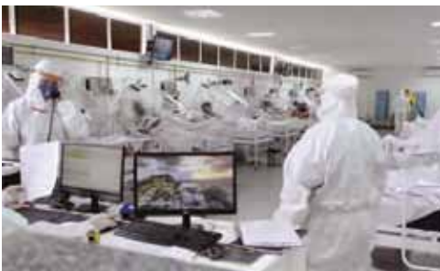
PAHO. Etienová zároveň vyzvala na prikrôčenie k "agresívnym preventívnym opatreniam" voči neprenosným chorobám ako cukrovka či ochoreniam

Na americkom svetadieli - v Severnej Amerike a Južnej Amerike - zdravotnícke úrady evidujú už viac než 2,4 milióna prípadov nákazy novým druhom koronavírusu a vyše 143.000 súvisiacich úmrtí, čo z tohto regiónu robí v globálnom meradle nové ohnisko pandémie COVID-19. Vyhlásila to v utorok riaditeľka Panamerickej zdravotníckej organizácie (PAHO) Carissa Etienová, ktorú citovala tlačová agentúra DPA. Podľa jej slov je PAHO zvlášť znepokojená vysokou mierou výskytu infekcie v Brazílii - kde tamjší prezident Jair Bolsonaro kritizuje obmedzenie pohybu obyvateľstva, ako aj v Peru tak aj v Čile. Pre väčšinu krajín tohto svetadielu "teraz nie je vhodný čas na zmierňovanie opatrení alebo znižovanie preventívnych stratégií", uviedla Etienová vo vyhlásení pre médiá, citovanom na oficiálnej webovej stránke