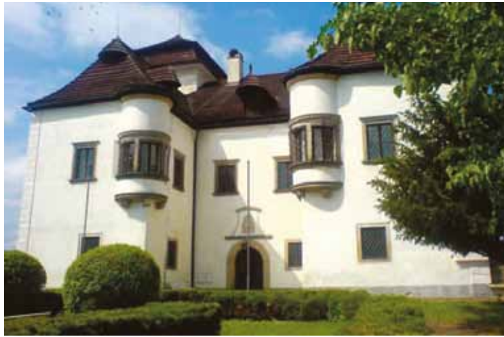
Renesančný kaštieľ v Diviakoch - postavený rodom Platy

Predpokladá sa, že po rozpade Veľkomoravskej ríše v Turci zostali pôvodní majitelia priestoru. Vladykovia zo svojich opevnení a tvrdzí ovládali krajinu a to až do jeho začlenenia do Uhorského kráľovstva (asi 1092 - 1094), kedy v boji s vojskami Ladislava I. (1077 - 1095) buď položili životy, alebo sa novému pánovi podvolili. Prvá písomná zmienka o šľachticoch z Turca je z r. 1224 a týka sa majetkových sporov, ktoré musel riešiť uhorský kráľ Ondrej II. (1205 - 1235). Nová šľachta, ktorá majetky v Turci získavala kráľovskými donáciami, sa dostávala do konfliktu s domácimi slobodnými vlastníkmi pôdy. Poriadky v majetkových sporoch urobil v r. 1255 počas svojho letného pobytu na hrade Turiec /dnes Zniev/ kráľ Belo IV. (1235 - 1270), ktorý tiež stanovil počet šľachtických rodín v Turci na štyridsať. Ich majetkové spory sa ale ťahli celým stredovekom. Od r. 1339 bol Turiec samostatnou uhorskou stolicou. Neskôr stredovekí turčianski župani až na niektoré výnimky nepochádzali z radov domácich zemanov. Svoj vplyv mohli prejavovať počas stoličných zhromaždení - kongregácií, ktoré sa konali asi raz ročne od 30. rokov 14. stor. v Martine alebo v Mo-