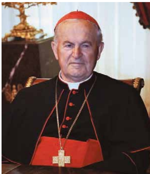
J.E. Kardinál Jozef Tomko