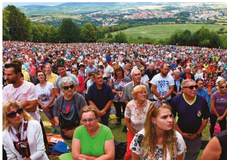
Púť na Mariánskej hore v Levoči

stojí v Božom okne, pozerá sa na nás a žehná nám." Ján Pavol II. je pochovaný v Bazilike sv. Petra vo Vatikáne. Dátum začiatku pontifikátu