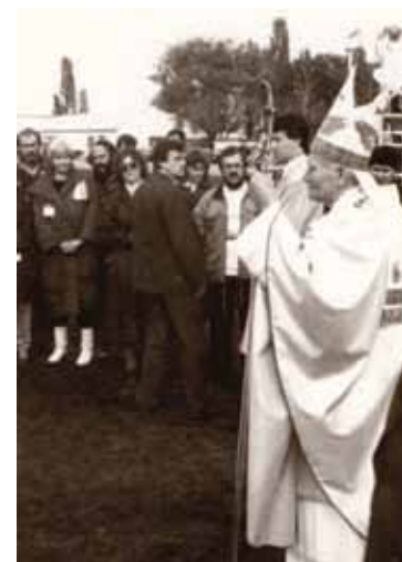
Na letisku vo Vajnorochoch v roku 1990

Grodeckého. Na Mariánskej hore pri Levoči prišlo na omšu s pápežom Jánom Pavlom II. viac ako 500.000 veriacich. Svätý Otec zavítal aj do Šaštína, kde pobudol v sazeziánskom kláštore a pred bazilikou Sedembolestnej Panny Márie odslúžil omšu.