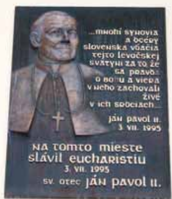
Pamiatka na jeho prítomnosť v Levoči na Mariánskej hore v roku 1995 som: "Santo Subito" (Ihneď svätý). Kardinál Joseph Ratzinger na záver zádušnej homílie povedal: "Môžeme si byť istí, že náš milovaný pápež teraz