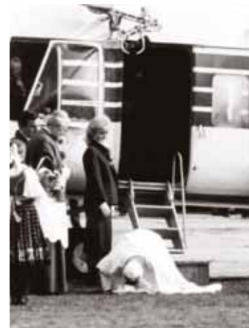
Ján Pavol II. bozkáva slovenskú zem na letisku vo Vajnorochoch v roku 1990

Šaštína. Počas návštevy v Košiciach dňa 2. júla vzdal hold katolíckmi zavraždených protestantom v 17. storočí. Jeho návšteva na Slovensku prispela k lepšiemu pochopeniu náboženského čítania a tolerancie. K vrcholom návštevy na východe Slovenska patrilo vyhlásenie troch košických mučeníkov za svätých. Svätý Otec v homílii 2. júla 1995 vyhlásil za svätých Marka Križina, Štefana Pongráca a Melichara