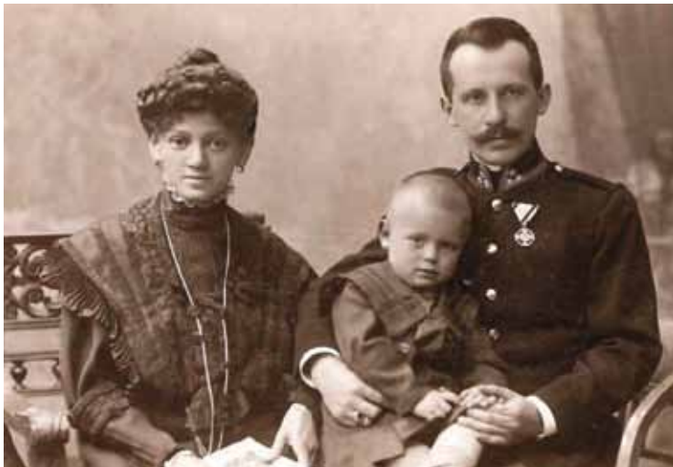
Rodičia s malým Karolom Wojtylom

Grodeckého. Na Mariánskej hore pri Levoči prišlo na omšu s pápežom Jánom Pavlom II. viac ako 500.000 veriacich. Svätý Otec zavítal aj do Šaštína, kde pobudol v sazeziánskom kláštore a pred bazilikou Sedembolestnej Panny Márie odslúžil omšu.