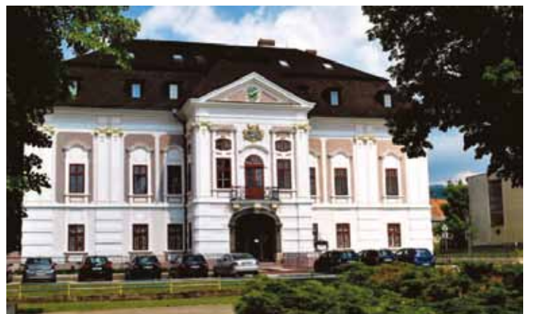
Kaštieľ v Mošovciach