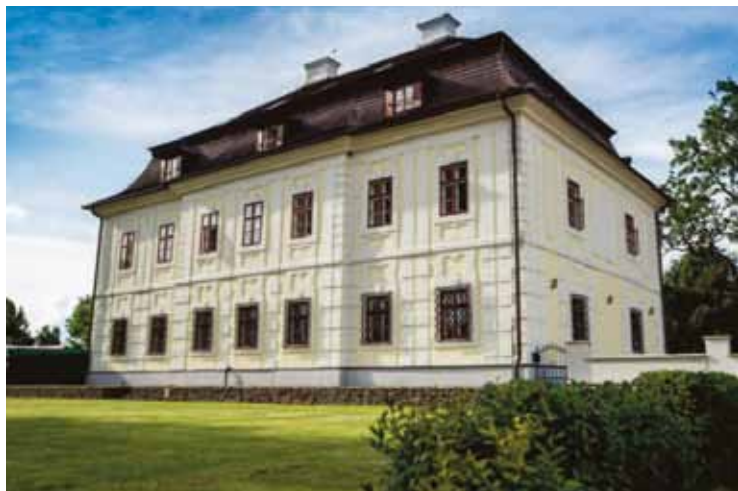
Kaštieľ rodu Tarnóczy