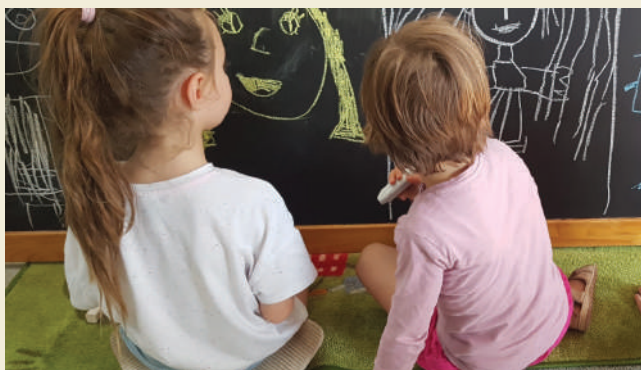
Škola sa nám začala